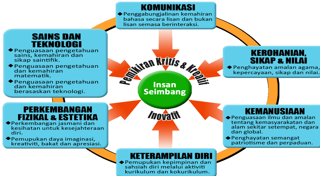
Bentuk Kurikulum Transformasi